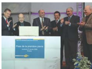
Jean-Paul Bailly, Président du groupe La Poste et les élus tourangeaux se félicitent de l'installation de la Plateforme Courrier à Sorigny